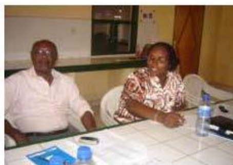
Les membres du jury entrain de délibérer