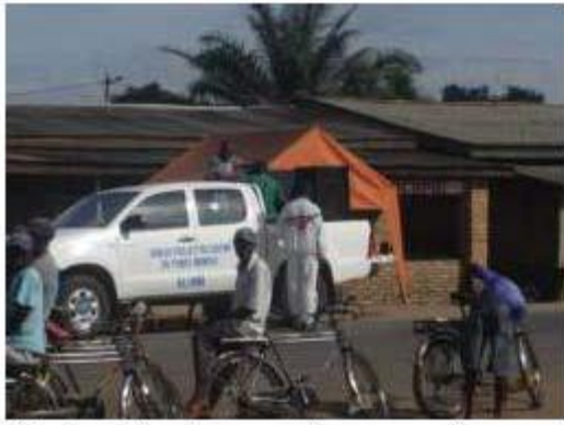
Pendant les travaux de curage, les gens écoutent des chansons sur la lutte contre la malaria.