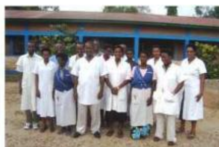
Les membres de A.LU.MA-Burundi Personnel de A.LU.MA-Burundi