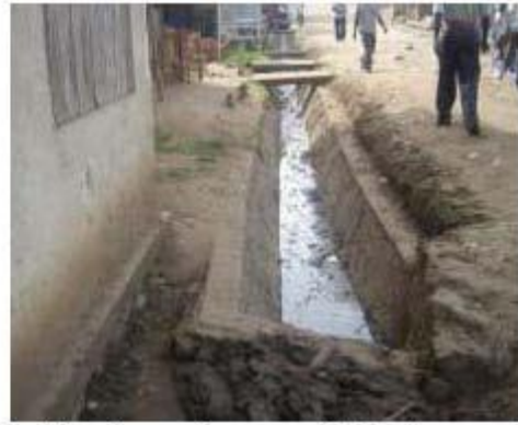
Situation du caniveau après les travaux de curage.